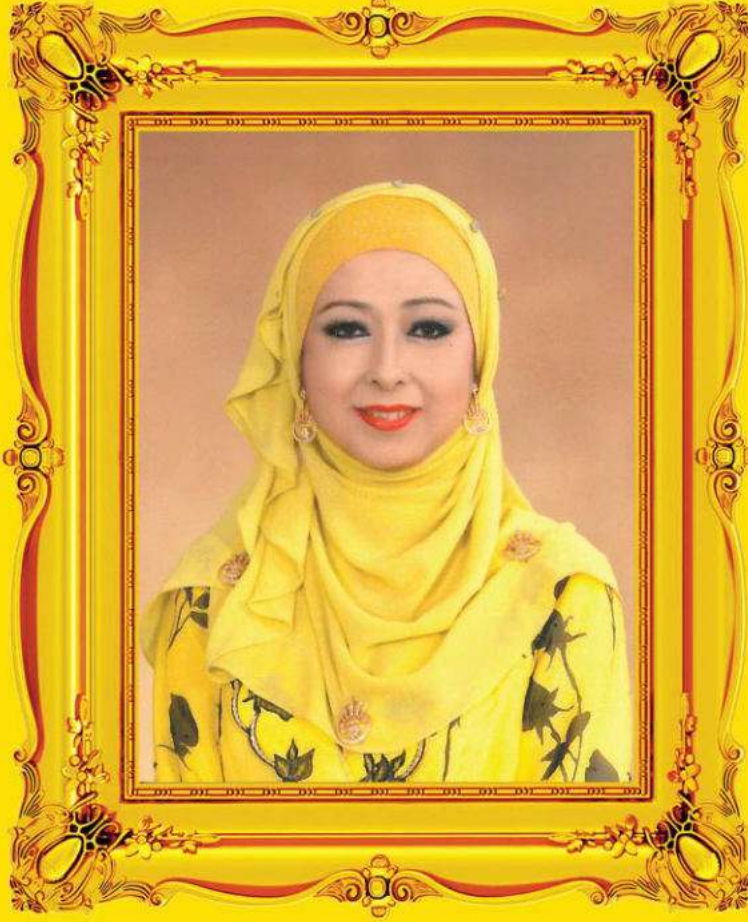
دولي يڠ ترامت موليا راج ثوان بسر فيراق دارالرضوان راج نظة الشيا بنت المرحوم سلطان ادريس عفيف الله شاه S.P.C.M., S.S.A.P., J.P.