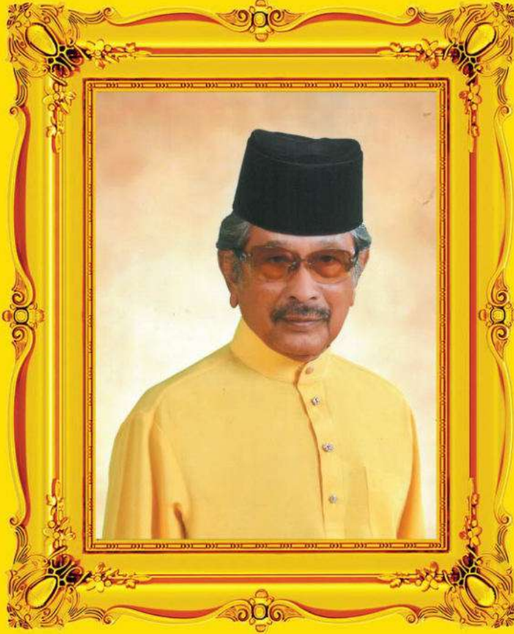
دولي يث ترامت موليا راج مودا فيراق دار الرضوان راج جعفر ابن المرحوم راج مودا موسى D.K., D.K.A., S.P.C.M., J.S.M.