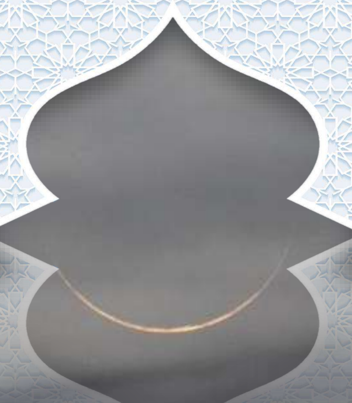
Gambar Menunjukkan Hilal Rabiul Akhir 1440H di Baitul Hilal, Pantai Pasir Panjang, Perak.